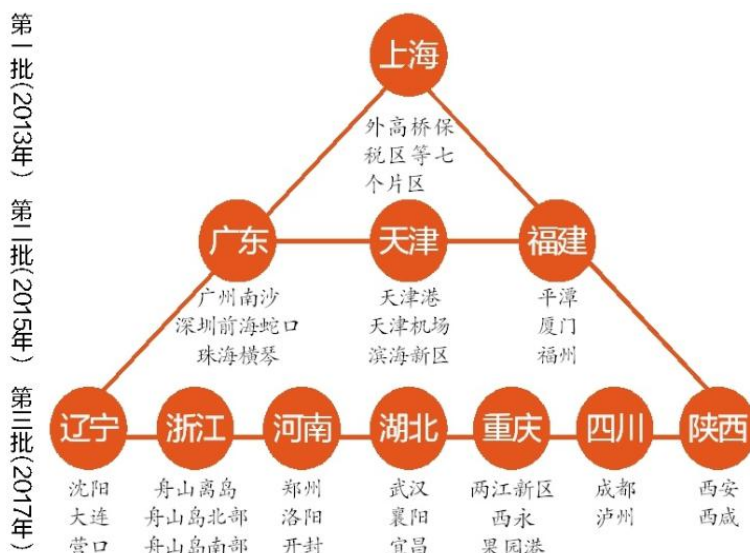
图 3-1 “一带一路”与中国自贸试验区雁行矩阵

陕西作为对外开放的西部门户省份和丝绸之路经济带的重要节点省份，加强陕西自贸区在“一带一路”中的政策融合程度，需要重点把握以下方面。